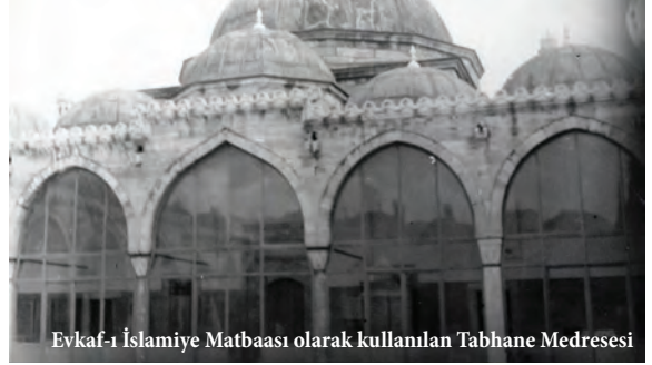
Evkâf-ı İslâmiye Matbaası olarak kullanılan Tabhane Medresesi

Gerek Osmanlı ve gerekse 1 Kasım 1928 tarihinde harf devrimi yapıncaya kadar Cumhuriyet döneminde, bu matbaada çok kıymetli eserler basılmıştır. Basılan eserlerin başında Ahmet bin Ali er-Razî'nin “Ahkâmü'l_Kurân” isimli tefsiri ile vakıfların tarihçesini anlatan “Evkâf-ı Hümâyûn Nezâreti'nin Tarihçe-i Teşkilâtı ve Nuzzârın Teracüm-i Ahvali” kitabı gelmektedir.